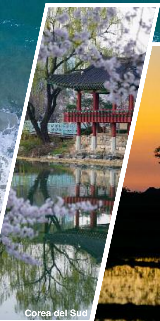
Corea del Sud