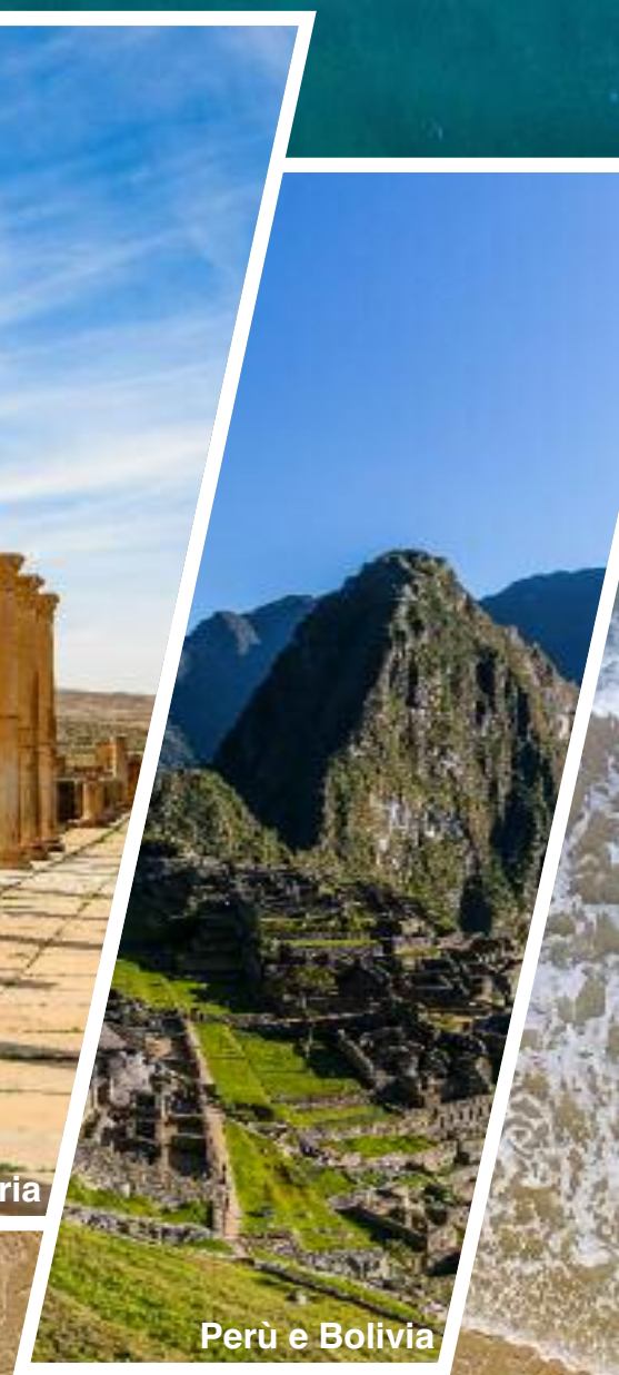
Perù e Bolivia

COREA DEL SUD, ALGERIA, PERÙ E BOLIVIA, MADAGASCAR SONO LE NUOVE AFFASCINANTI PROPOSTE PER IL PROSSIMO ANNO